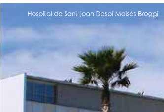
Hospital de Sant Joan Despí Moisés Broggi