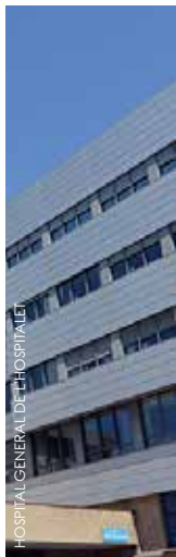
HOSPITAL GENERAL DE L'HOSPITALET