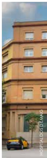
HOSPITAL DOS DE MAIG